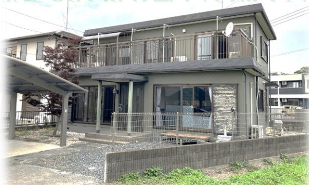
敷地内南東方面より現地外観 ※街並み含む